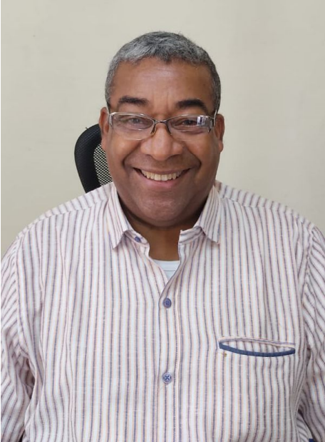
Por Carlos Enrique Santacruz Caicedo Rector Institución Educativa