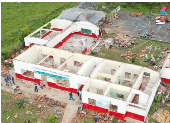
Propuesta arquitectónica Juan B. Echeverri

Gracias a la organización de la vereda y la vinculación de los directivos de la institución y docentes, fue posible desalojar la escuela e iniciar el proceso de demolición de la misma, mediante un convite programado en los días 22, 23 y 24 de abril. Actualmente los trabajos en la obra avanzan de forma satisfactoria y de acuerdo a los planeado.